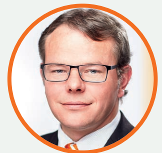
Michael Baskow Michael Baskow Geschäftsführender Partner Steuerberater