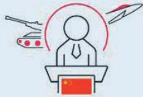
Politische und militärische Muskelspiele